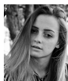
SANDRA SLOBODOVÁ FOTOGRAF