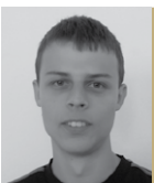
DOMINIK MOKRÝ GRAFIKA