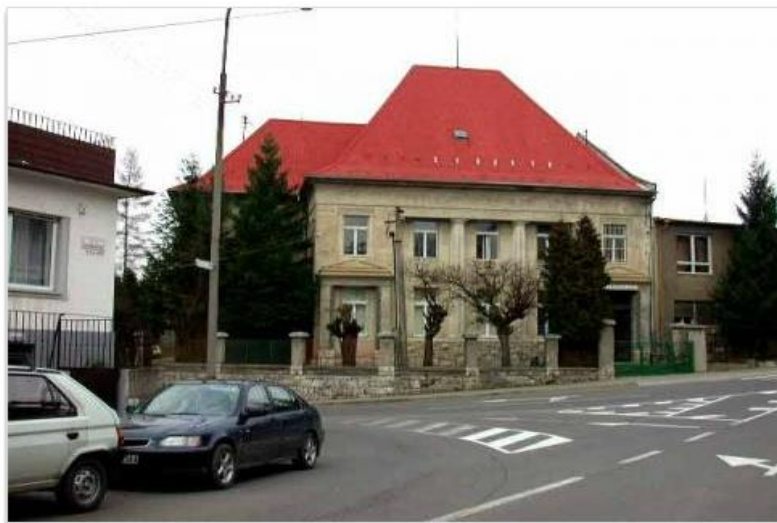
Pohľad na hlavnú budovu

istý čas prepožičiavať priestory na vyučovanie od ZŠ Školská v Bánovciach nad Bebravou.